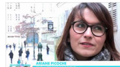
CANAL+ Le Before du Grand Journal