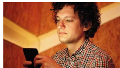
Le Monde M le magazine Le Tag Parfait, le site qui réhabilite la culture porn