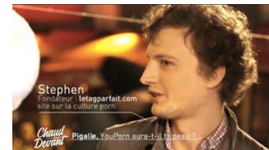
FRANCE 4 Émission Chaud Devant