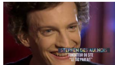
CANAL+ Documentaire « A Poil Mais Stylé »