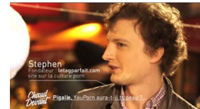
FRANCE 4 Émission Chaud Devant