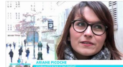
CANAL+ Le Before du Grand Journal